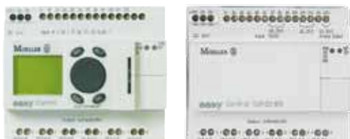
EC4P с дисплеем и без дисплея

Контроллеры EC4P предлагают производительность ПЛК в корпусе традиционного интеллектуального реле. Это дает возможность удобной реализации компактных и средних систем управления. Простое программирование, совместимое с IEC-61131 с помощью easySoft-CoDeSys – основа удобства данного семейства, дополняемая мощным процессором. Отдельным преимуществом контроллера являются коммуникационные возможности. Последовательный или Ethernet интерфейсы для программирования и соединения с клиентами OPC, а так же CANopen и easyNet для взаимодействия с другими компонентами полевых шин дают большие коммуникационные возможности.